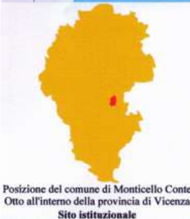
Posizione del comune di Monticello Conte Otto all'interno della provincia di Vicenza Sito istituzionale