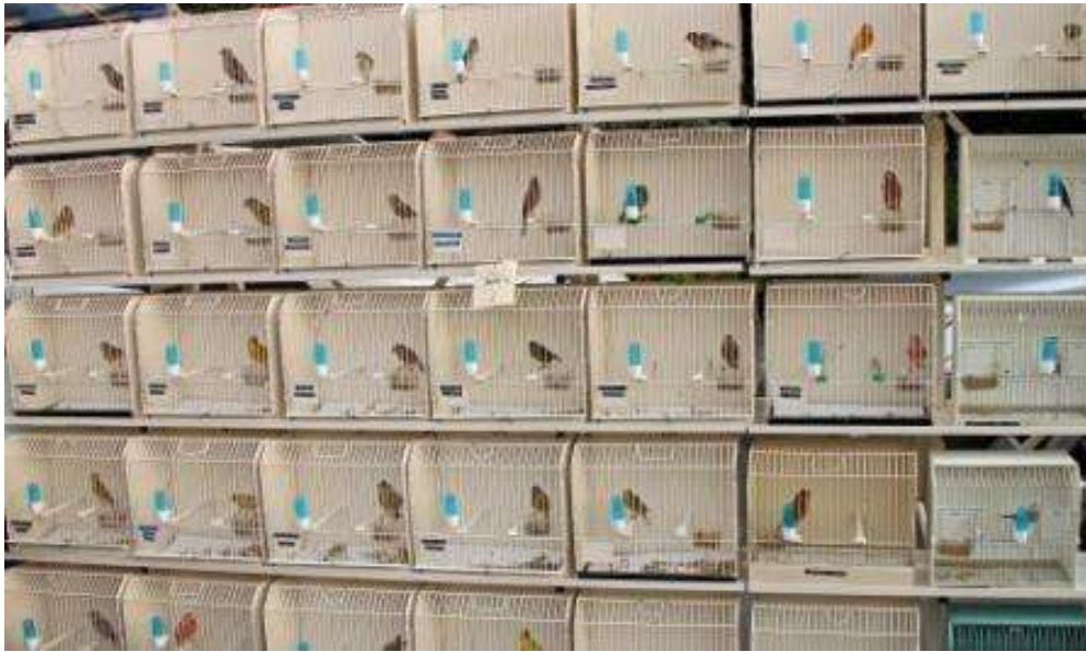
Gruppo ibridi .