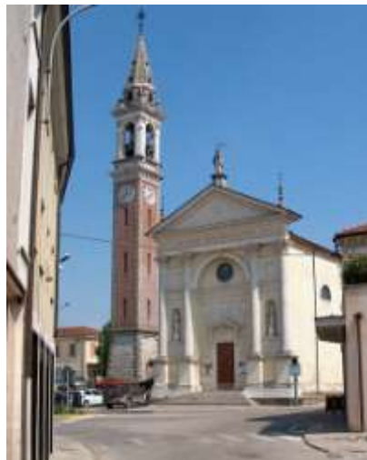
Chiesa di CAVAZZALE