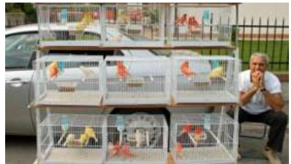
Il "vecchio autentico" allevatore.