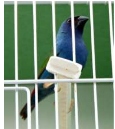
Gruppo esotici : L'ARCA di NOE' con uno dei tanti soggetti, il D. di TANIBAR (ERYT. TRICOLOR).